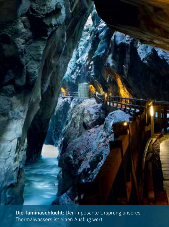
Die Taminaschlucht: Der imposante Ursprung unseres Thermalwassers ist einen Ausflug wert.