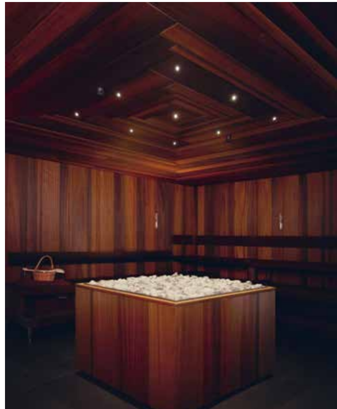
Sauna Nera: Ein einzigartiges Erlebnis – unsere Aussensauna. Eintritt Sauna ohne Badeintritt möglich.

Weitere Informationen und Angebote finden Sie auf www.taminatherme.ch/sauna